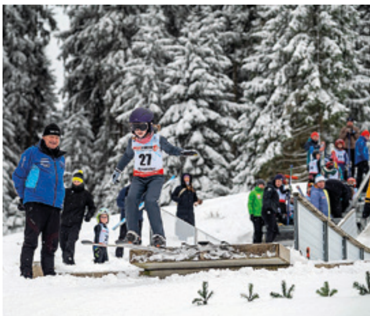
Die jüngsten Nachwuchssportler der Region stellten bei den Aschbergskspielen in Mühlleithen ihr Können im Mini-Skifliegen, der Mini-Kombination und im Vielseitigkeitsparcours unter Beweis.